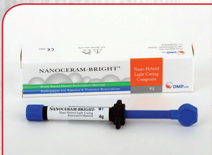
Nanohibridni univerzalni kompozit NANOCERAM-BRIGHT 4g