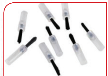
Četkice za bond a 25 kom. DMP