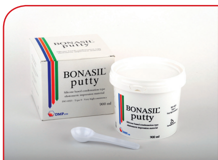
Kondenzacioni silikon (osnovni) BONASIL PUTTY 900ml (C-TYPE)