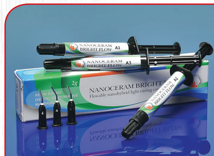
Nanohibridni tečni kompozit NANOCERAM BRIGHT FLOW (2g x 2 kom)