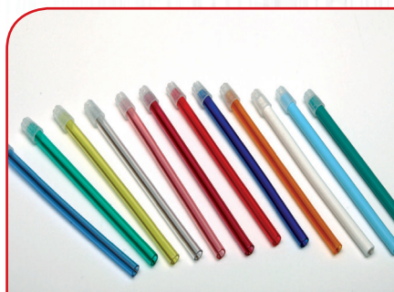
Stomatološka sisaljka A100