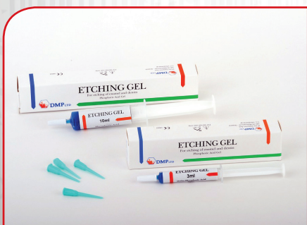
Kiselina za nagrizanje DMP ETCHING GEL 10ml