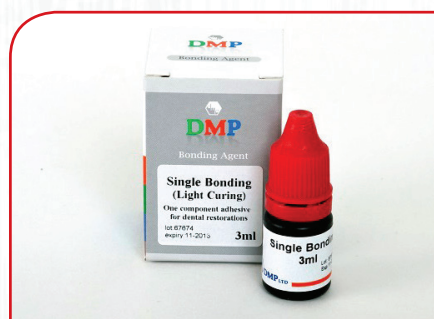
Svetlosno polimerizujući adheziv DMP SINGLE BOND 5ml