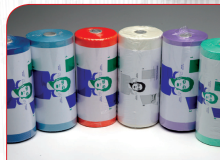
Kompresse za pacijente A80