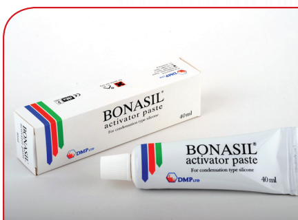
Kondenzacioni silikon (aktivator) BONASIL ACTIVATOR PASTE 60ml (C-TYPE)