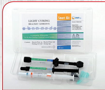
Adheziv za ortodonticiju- svetlosnopolimerizujući DMP BRACKET ADHESIVE - SET