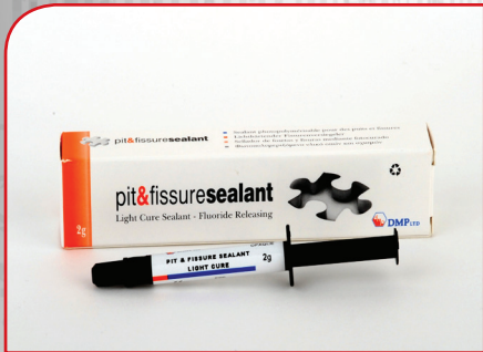
Zalivač fisura sa fluorom DMP PIT & FISSURE SEALANT 2g Opaque- PAKOVANJE OD 1 TUBE