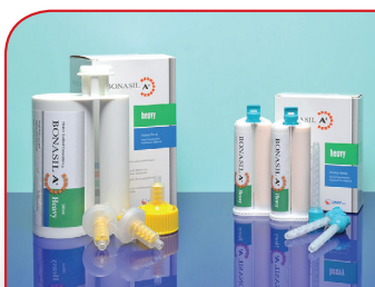
Adicioni silikon (sekundarni) BONASIL A+ HEAVY 50ml x 2