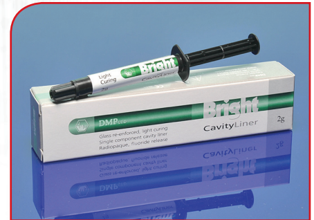
Kompozitni materijal za podloge BRIGHT CAVITY LINER 2g