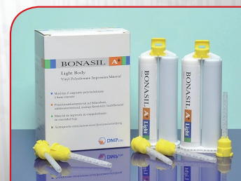
Adicioni silikon (sekundarni) BONASIL A+ LIGHT 50ml x 2