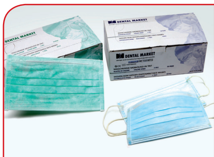
Hirurške maske sa gumicom A50