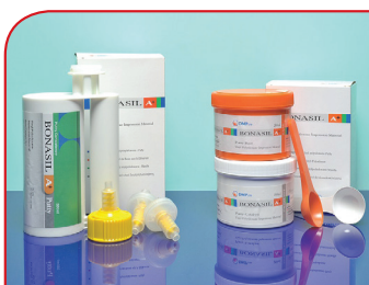
Adicioni silikon (primarni) BONASIL A+ PUTTY 400g + 400g