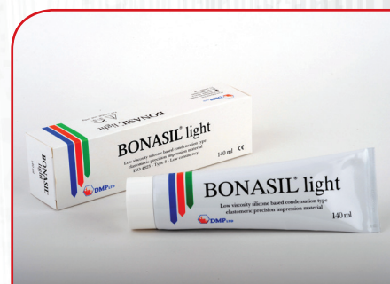
Kondenzacioni silikon (korektivni) BONASIL LIGHT BODY 140ml (C-TYPE)