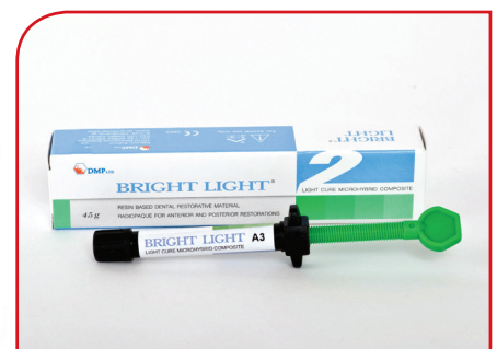
Mikrohibridni univerzalni kompozit BRIGHT LIGHT MICROHYBRID 4.5g