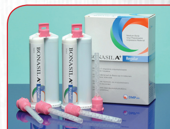
Adicioni silikon (sekundarni) BONASIL A+ REGULAR 50ml x 2